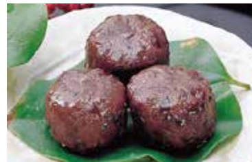
栗入り黄味あんを 甘さを抑えた 小豆あんで包み 蒸し上げました しっとりとした 味わいです

賞味期限 製造日+60日 小1箱 (12カツ) 540円 大1箱 (18カツ) 756円