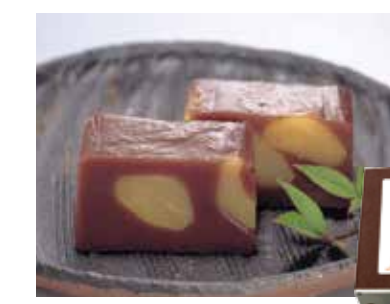
栗と小豆の豊かな風味 じつくりと蒸し上げた つややかな色合いは 代表的な秋のお菓子です