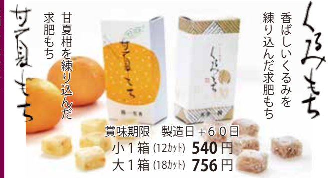
甘夏柑を練り込んだ 求肥もち